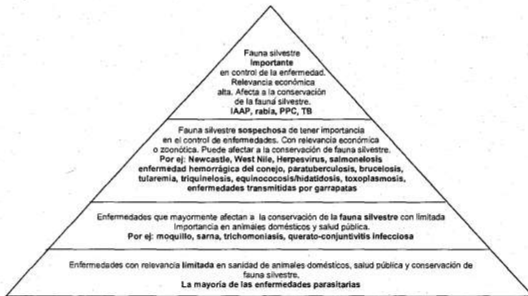
Figura 2.- Enfermedades de la fauna silvestre, clasificadas según su importancia en relación con la sanidad animal y otros factores.

En un número de casos, las evidencias científicas no son todavía suficientes para decidir si la fauna silvestre española tiene una elevada probabilidad de ver afectado su estatus sanitario o no. Son enfermedades que merecen unos esfuerzos de investigación mayores, con el fin de tomar la primera decisión en cuanto a la importancia de la fauna silvestre en relación con su control. Finalmente, otras muchas enfermedades tienen un impacto más limitado sobre la economía y la salud pública, enfermedades cuya vigilancia y control no se considera prioritario.