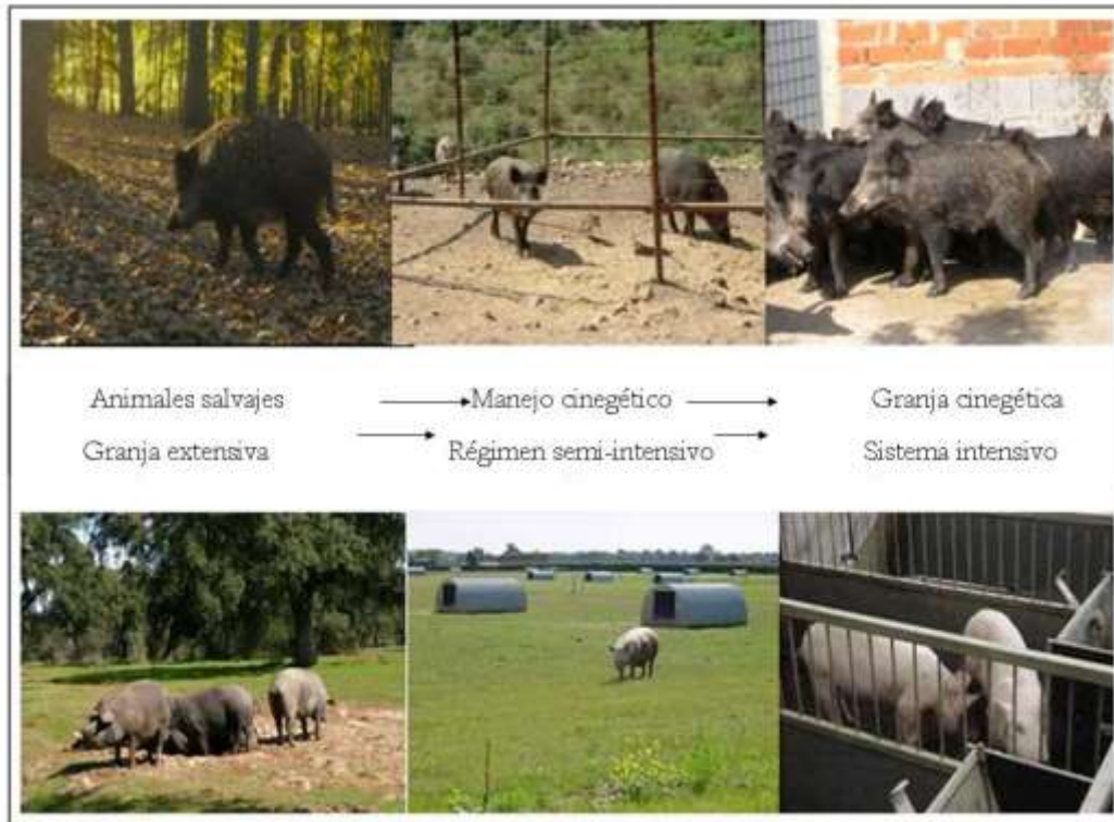
Figura 1.- Los cambios en el manejo de la fauna silvestre (hacia modelos más intensivos) y en la producción ganadera (hacia modelos más extensivos) complican la epidemiología y el control de las enfermedades compartidas.