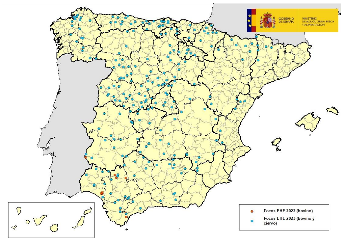
Mapa 1: Comarcas afectadas por EHE en España en años 2022 y 2023

Desde la última actualización sobre la enfermedad realizada el pasado 02 de noviembre, el Laboratorio Central de Veterinaria (LCV) de Algete, laboratorio nacional de referencia para esta enfermedad, ha confirmado casos de enfermedad hemorrágica epizootica (EHE) en 13 nuevas comarcas. Todos ellos se han detectado en explotaciones de bovino en las comarcas de: Estella (Navarra); Belmonte de Miranda, Ribadesella, Grado y Cangas de Onís (Asturias); Lugo y Terra de Lemos-Quiroga (Lugo); Maceda, Ourense y O Carballiño (Ourense); Potes (Cantabria); Noguera (Balaguer) (Lleida) y Boñar (León). Ver mapa 1.