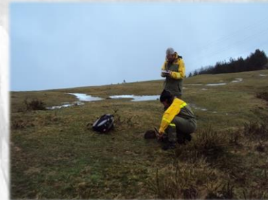
Recogida de muestras suelo, 2014