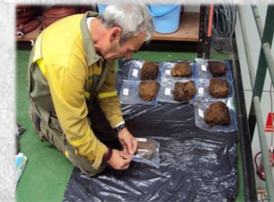
Organización muestras de suelo, 2014

En los últimos 5 periodos ha participado en la quema de más de 771 ha.