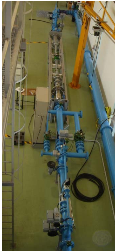
Figura 4 - Banco de pérdidas de carga y comprobación de los dispositivos de regulación. Laboratorio Central para ensayo de materiales y equipos de riego del MARM.CENTER.

En las instalaciones del Laboratorio Central para ensayo de materiales y equipos de riego del Centro Nacional de Tecnología de Regadíos (CENTER), perteneciente a la SG de Regadíos y Economía del Agua del MARM ( http://www.center.es/laboratorio.php ), se cuenta con bancos diseñados para realizar la gran mayoría de ensayos prescritos por las normativas a las que se ha hecho referencia en el presente trabajo.