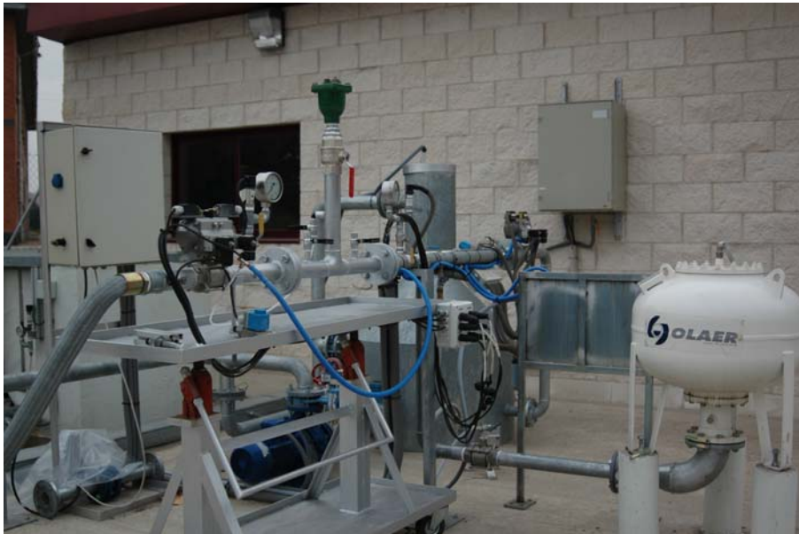
Figura 3 Banco de durabilidad Estático. Ensayo de Ventosas. Laboratorio Central para ensayo de materiales y equipos de riego del MARM.CENTER