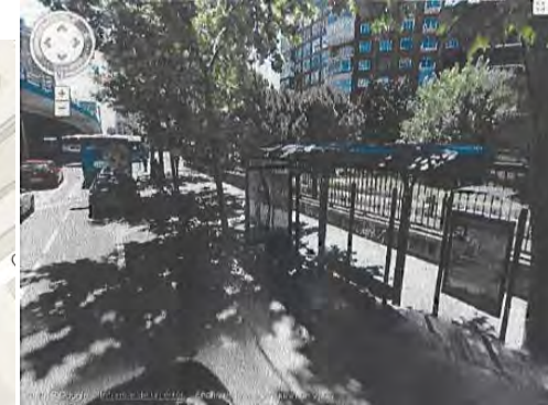
Vista de la parada