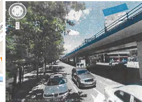
Vista desde la parada: Se puede tomar como referencia el edificio que sobresale en la esquema superior derecha con un reloj debajo

La parada de autobús donde se realiza la recogida esta remarcada con circulo rojo. -La estación de metro mas cercana es "Avenida de América" salida a Príncipe de Vergara. Salida a las 08:00 H., el autobús es de la empresa "Najera" y lleva un distintivo con el nombre del Ministerio y las siglas CENCA.