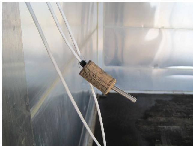
Figura 3: Empleo de material aislante

En caso de que la parte metálica de la vaina quede en el exterior se recomienda proteger con material aislante (corcho, plástico, etc.).