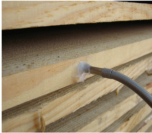
Figura 2: Correcto sellado de sondas

Si para mayor facilidad en la introducción y extracción de las sondas se practicasen en la madera orificios de mayor diámetro que los de las sondas, será necesario proceder a su sellado externo mediante el empleo de un producto adecuado que impida la entrada de aire.