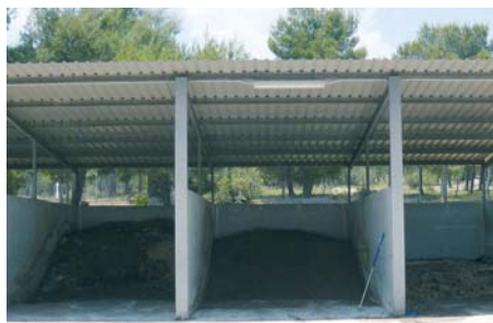
Figura 3. Almacenamiento de deyecciones sólidas en estercolero.