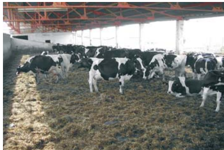
Figura 2. Cama de paja en una explotación de vacuno.