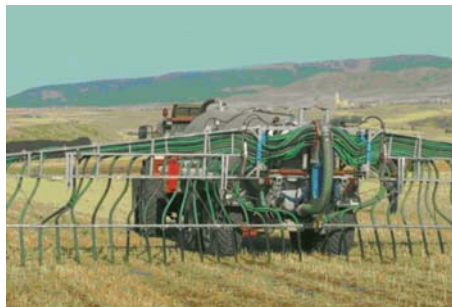
Figura 6. Sistema de aplicación de deyecciones líquidas mediante inyección superficial.

Esta técnica está diseñada principalmente para usarse en pastizales (Figura 6). Mediante cuchillas de formas diferentes o arados de disco se abren ranuras verticales dentro de las cuales se deposita el estiércol líquido.