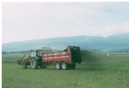
Figura 5. Sistema de aplicación de deyecciones mediante esparcido.

En superficies reducidas el esparcido se puede realizar de forma manual o con el apoyo de maquinaria menor.