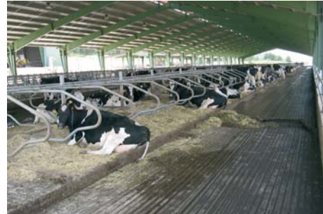
Figura 4. Sistema de retirada de deyecciones mediante arrobaderas en una explotación de vacuno.

explotaciones en las que existe un pasillo interior de limpieza (Figura 4). Las más extendidas son las automáticas o autónomas accionadas por motor eléctrico mediante diversos sistemas (hidráulicos, cadenas o cables).