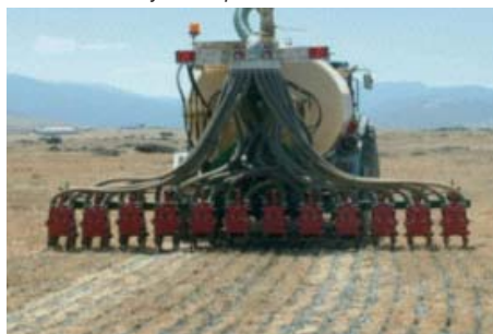
Figura 7. Sistema de aplicación de deyecciones líquidas mediante inyección profunda

La aplicación puede ser inducida por gravedad o mediante alguna otra fuerza mecánica externa (bombas).