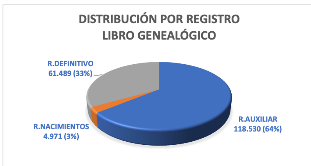
Figura 1. Distribución porcentual de los distintos Registros del Libro Genealógico