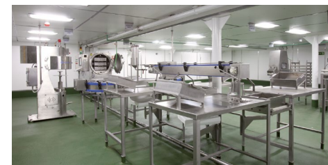
Zone de traitement et de transformation