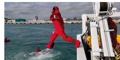
Sécurité dans la mer