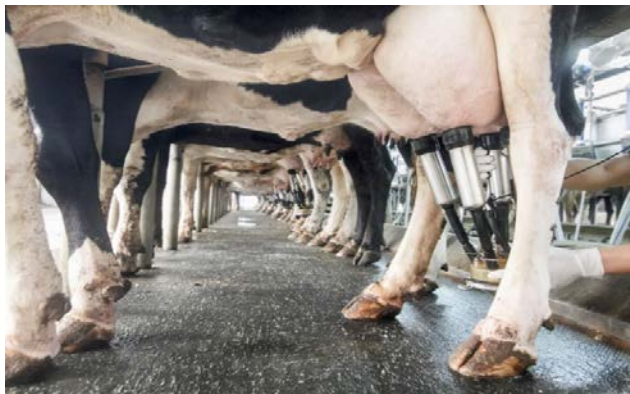
Imagen: Ministerio británico de Medio Ambiente, Alimentación y Asuntos Rurales

Los productores lácteos han puesto de manifiesto los graves efectos financieras que están sufriendo como consecuencia de la pandemia del coronavirus, a pesar del aumento de la demanda minorista, por lo que el Gobierno está estudiando, como cuestión urgente, el dirigir la leche desde el sector de la hostelería hacia el mercado minorista.