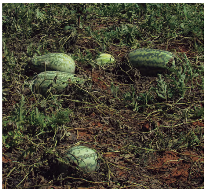
Sandías listas para su recolección. Emilio Laguna

Para determinar el punto de madurez adecuado para recolectarla se han empleado popularmente diversas técnicas, que podemos agrupar en dos: las que tienen que ver con la observación de la planta y las que se fijan en la propia sandía.