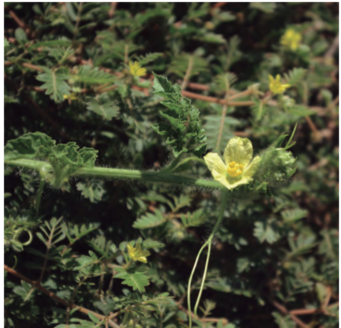
Tallo joven con flor. Emilio Laguna

Finalmente, en Tentudía se ha citado también la plaga de la langosta o cañafote (probablemente Doclostaurus maroccanus (Thunberg, 1815)), capaz de destruir el melonar entero [39] y en Monfragüe la mosca [9], que podría tratarse de mosca blanca [ Bemisia tabaci (Gennadius, 1889)]. En esta última comarca cacereña, para proteger a