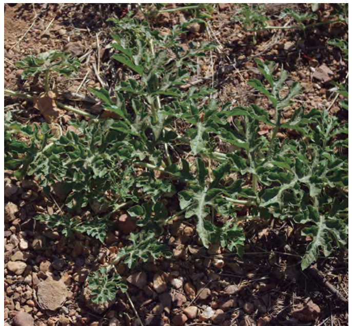
Tallos de sandía orientados en la misma dirección. Emilio Laguna

Otro tipo de variedades tradicionales son las de carne blanca o amarilla, como la llamada sandía blanca o sandía de invierno , en Extremadura y Castilla y León [9,19,39,40,43,53], que como ya se ha comentado, se conservaban durante largos periodos de tiempo. También de carne blanca es la sandía blanca rayada , de Cortegana (Huelva), que da sandías pequeñas de muy buen sabor [51].