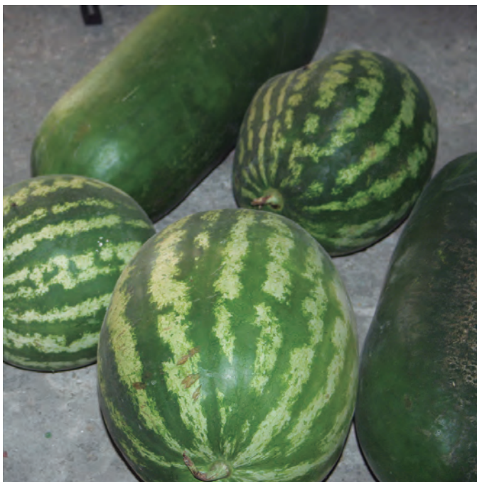
Cosecha de sandías. Blanco Martínez Injames

Una vez recolectada es bueno dejar la sandía dos días en un lugar fresco y seco para que madure y se ponga más dulce y roja [41]. Según algunos, su conservación puede ir desde dos semanas a un mes sin que se estropeen por fuera [41,43], aunque puede llegar a fermentar la pulpa [44]. Sin embargo, al menos en Extremadura, algunas variedades de sandía de carne blanca o amarilla, denominadas sandías de invierno, se conservaban durante largos periodos de tiempo [9,39,40,53] y se mantenían hasta Nochebuena [39]. Para ello, se almacenaban en los pajares o doblados, bien colgadas de un palo, o de unas redes hechas de junco o de pita, o entre dos cuerdas horizontales; o bien se echaban sobre el grano del cereal [9,39,43]. Cuando son más pequeñas se reduce el riesgo de podredumbre [43]. Estas sandías de invierno no eran tan apreciadas como las de verano, pues no se suele considerar muy adecuado para el invierno un postre tan frío y acuoso [39,40,53].