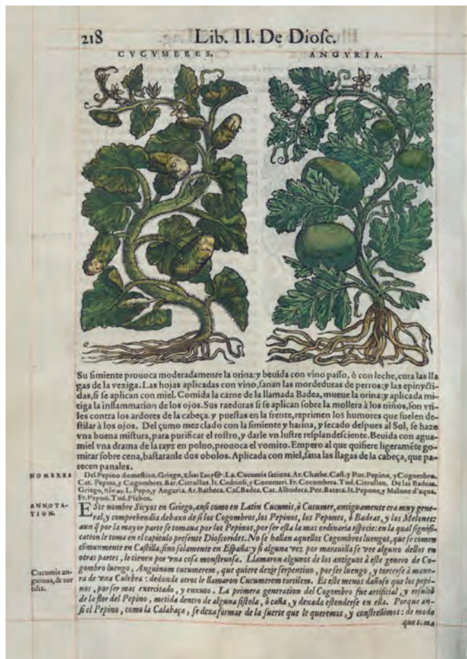
Láminas de pepino (izquierda) y de sandía (derecha) en el Dioscórides de Laguna (1555)

La pérdida del uso de las variedades tradicionales se ha registrado en la gran mayoría de las regiones españolas [5,7,41,44]. En general, las sandías de variedades tradicionales son de mayor tamaño que las de las variedades comerciales actuales, que se adaptan mejor al menor tamaño familiar actual [53] y también dan más producción que las tradicionales [41]. Además, según cuentan en Doñana, las sandías