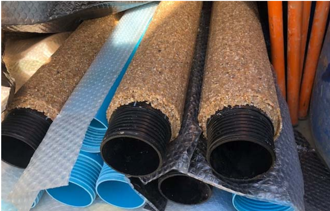
Figura nº 5. Detalle de empaque de tubería filtrante del dispositivo de control del lixiviado

Toda la cámara de captación entre la pared de perforación y la tubería filtrante está recubierta por grava sílicea homométrica, calibrada de tamaño 2 – 4 mm. Que cubre el "ánulus" de la cámara de captación hasta un mínimo de 160 mm por encima de la tubería filtrante. Ver figura nº 5.