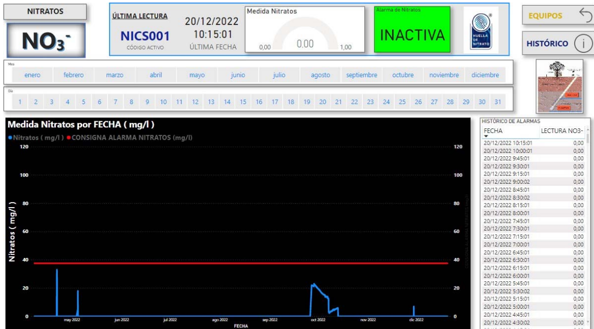
Figura nº 3. Determinación de episodios de lixiviado en tiempo real en el área de estudio.