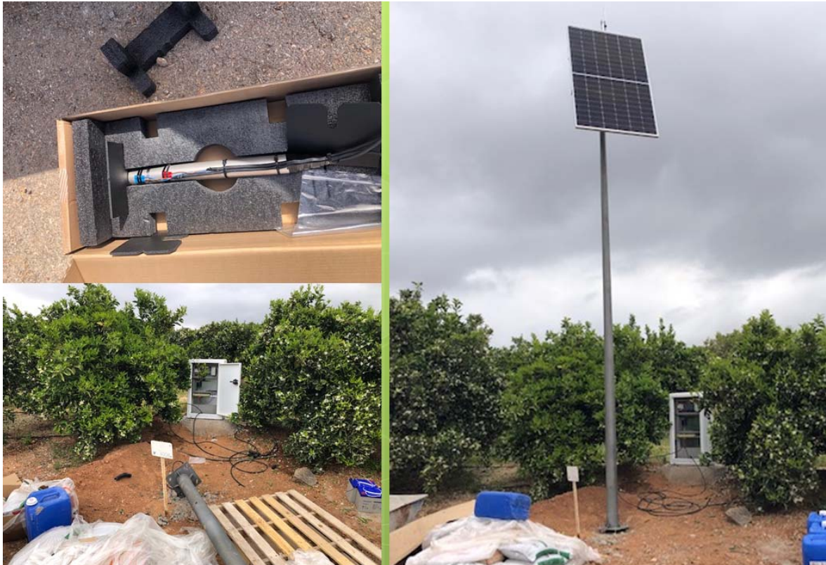
Figura nº 2. Instalación de espectrofotómetro en profundidad

En las zonas de vulnerabilidad alta, la información debe ser tratada en tiempo real ya que se debe garantizar la no lixiviación en los puntos críticos en todo momento. Dicha información se deberá analizar durante todo el año, estableciendo una serie de alarmas en el caso de que se produzca un lixiviado accidental, con objeto de que pueda ser corregido de forma inmediata. Para ello, en función de la ubicación de la superficie agrícola, es necesario incorporar un sistema de comunicaciones en tiempo real eficiente, así como una aplicación informática donde se puedan gestionar en tiempo real (visualizar, almacenar, establecer consignas, etc...) los datos recopilados por cada una de las sondas. Dicha aplicación se ha desarrollado en el entorno de Microsoft para poder ser visualizada por cualquiera que tenga licencia de Office 365, con objeto de que la Administración y por su puesto la Comunidad de Usuarios de que se trate, pueda visualizar en cualquier momento que no se produce vertido al medio. Ver figura nº 3