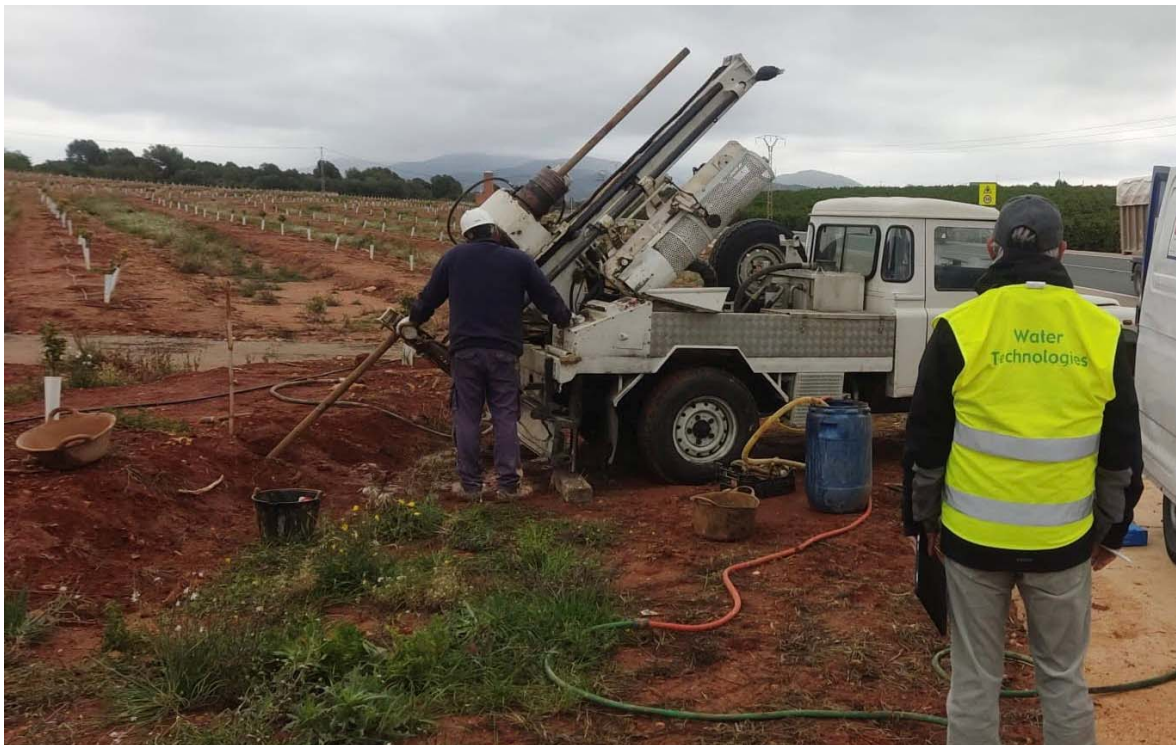
Figura nº 4. Detalle de instalación del dispositivo de control del lixiviado

Con objeto de captar exclusivamente el agua de lixiviado por debajo de la zona de alteración del suelo, en la parte inferior de detección y caracterización, se procederá al aislamiento del tramo superficial mediante cementación del anular del dispositivo hasta la superficie, con objeto de evitar contaminaciones superficiales.