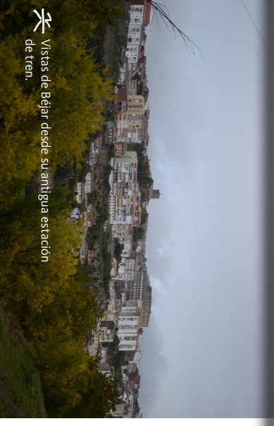
Vistas de Béjar desde su antigua estación de tren.

La gran variedad de flora proporciona una alta diversidad de hábitats poblados por más de 5000 especies de invertebrados y 300 de vertebrados. Entre éstos destacan por su importancia dos endemismos, la colmilliga del Alagón y la lagartija de la Peña de Francia, junto a especies bandera como la salamandra, los buitres leonado y negro, el águila-azor perdicera, la cigüeña negra, y dentro de los mamíferos, especies de caza como jabalí y el cervo o el linco ibérico.