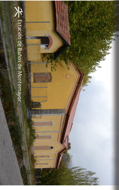
Estación de Baños de Montemayor