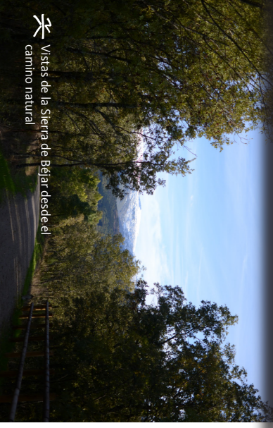
Vistas de la Sierra de Béjar desde el camino natural