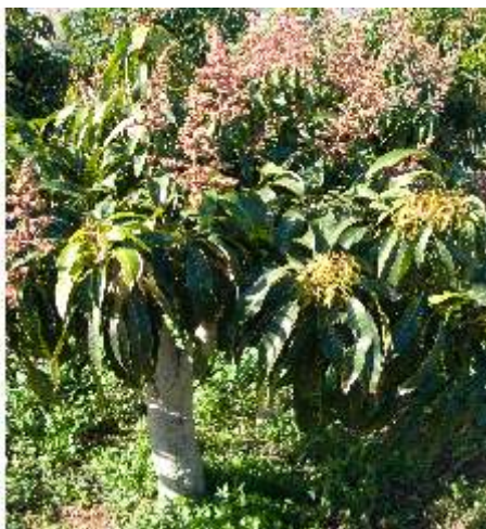
Árbol con flor y brotes de hoja.