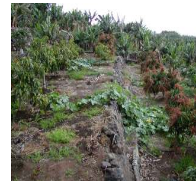
Unidades con flor y sin flor.