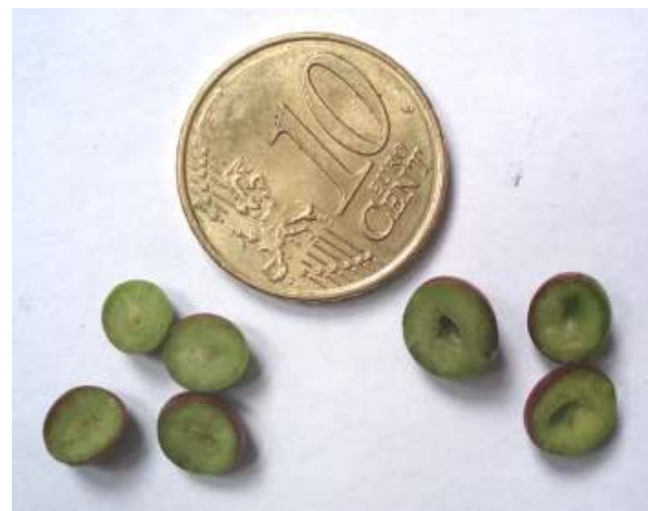
Izquierda: Frutos cuajados, derecha: Frutos abortados.

Por el contrario, los frutos que aparecen con su interior hueco son abortados. Si una gran mayoría de los frutitos presentan estas características se eliminaría la primera floración a la espera de una segunda.