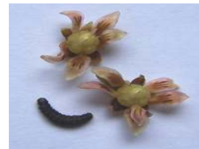
Polilla del racimo.